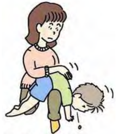
図2 背部叩打法変法 (少し大きい子)

また、少し大きい子は立て膝で太ももがうつぶせにした子のみぞおちを圧迫するようにして(図2)、どちらも頭を低くして、背中のみぞおちを平手で4、5回叩きます。なお、腹部臓器を傷つけないよう力を加減します。