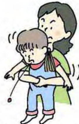
図3 ハイムリッチ法 (年長児)

この方法が行えない場合、横向きに寝かせて、または、座って前かがみにして背部叩打法を試みます。