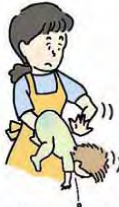
図1 背部叩打法 (乳児)

乳幼児では、口の中に指を入れずに、乳児は片腕にうつぶせに乗せ顔を支えて(図1)、