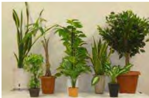
前列左から人工植物1、同2、同3 後列左からエコプラント4、同1、同2、同3、人工植物4

いずれの商品も室内空気の浄化力は乏しいため、商品だけでは除去効果は不十分です。定期的に部屋の換気を行うよう心がけましょう。